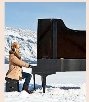
Fragmento de una de las obras de la exposición de la fundación TBA21.